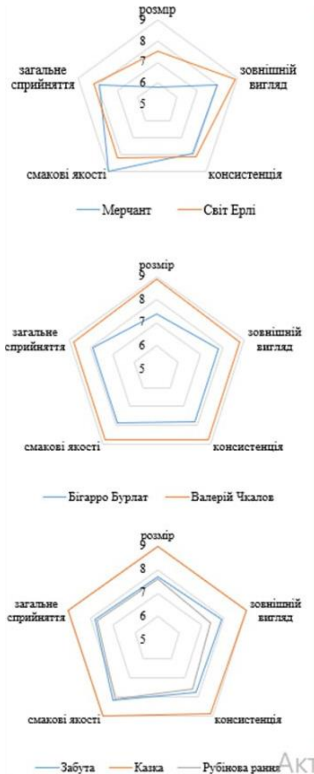
Рис. 1. Сенсорні профілограми свіжих плодів сортів черешні раннього строку досягання (середнє за 2007–2019 рр.)

Результати сенсорного оцінювання плодів черешні сортів середнього строку досягання наведено на рис. 2. Максимальну оцінку за розміром (9,0) отримали плоди сортів «Талісман», «Ділема», «Мелітопольська чорна» та «Простір». Найменші бали – сорти «Улюблениця Туровцева» (7,4) та «Червнева рання» (7,5). За зовнішнім