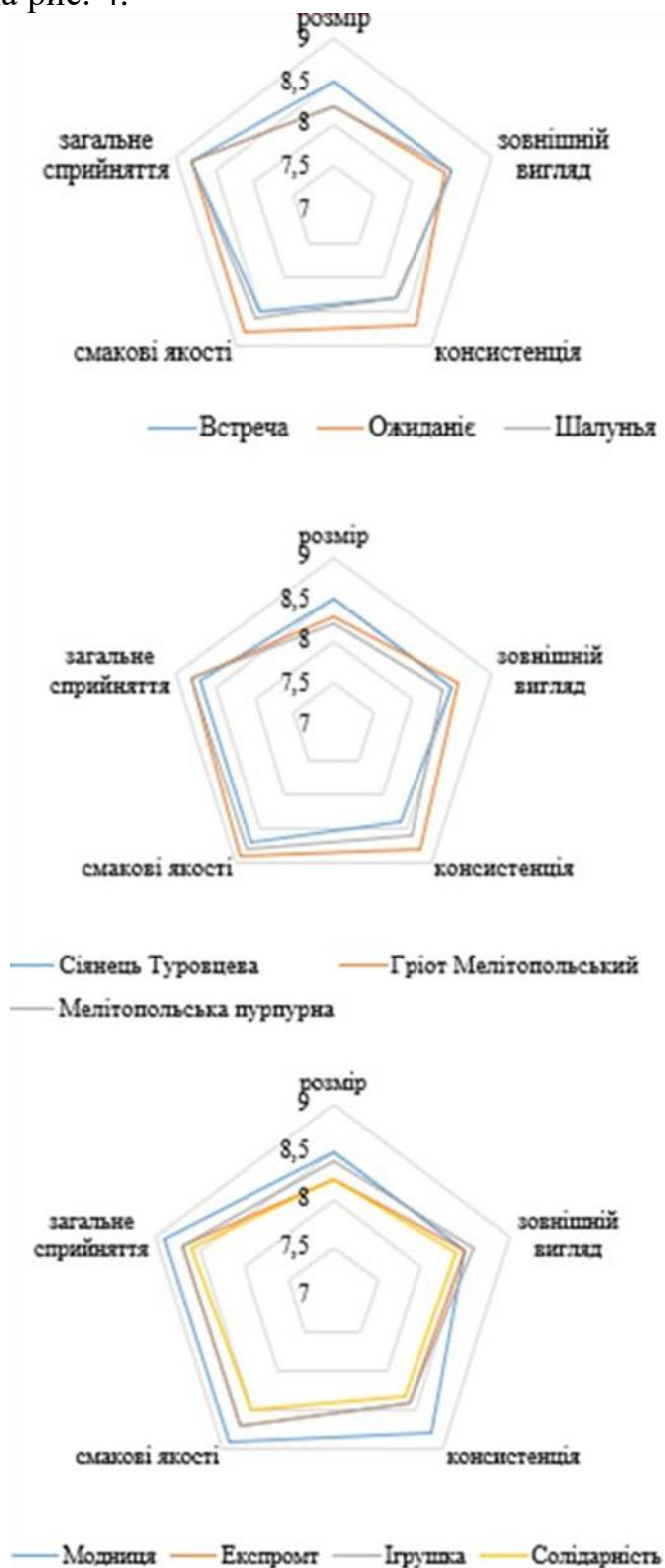
Рис. 4. Сенсорні профілограми свіжих плодів вишні (середнє за 2007–2019 рр.)

Результати експертизи сенсорного профілю плодів вишні представлені на рис. 4.